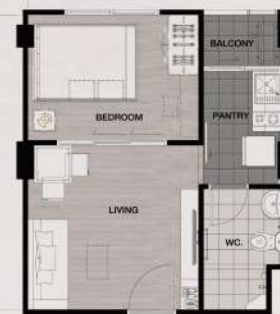
TYPE D : 30 Sqm.