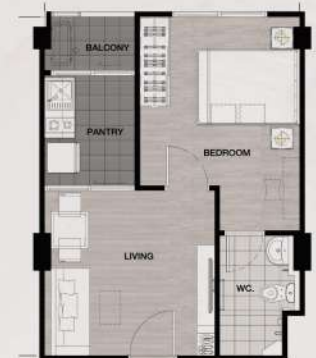
TYPE E : 35 Sqm.