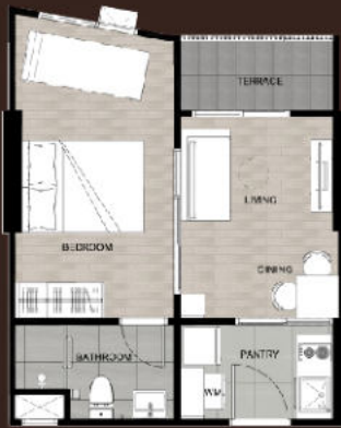
1-BR PLUS 33 Sq.m.