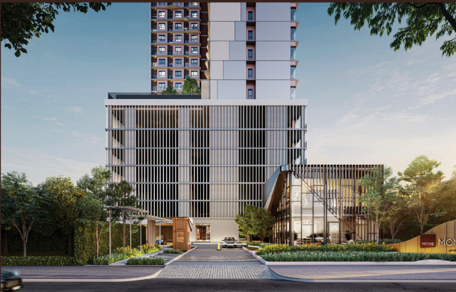
*ภาพและบรรยากาศจำลอง ใช้เพื่อการโฆษณาเท่านั้น