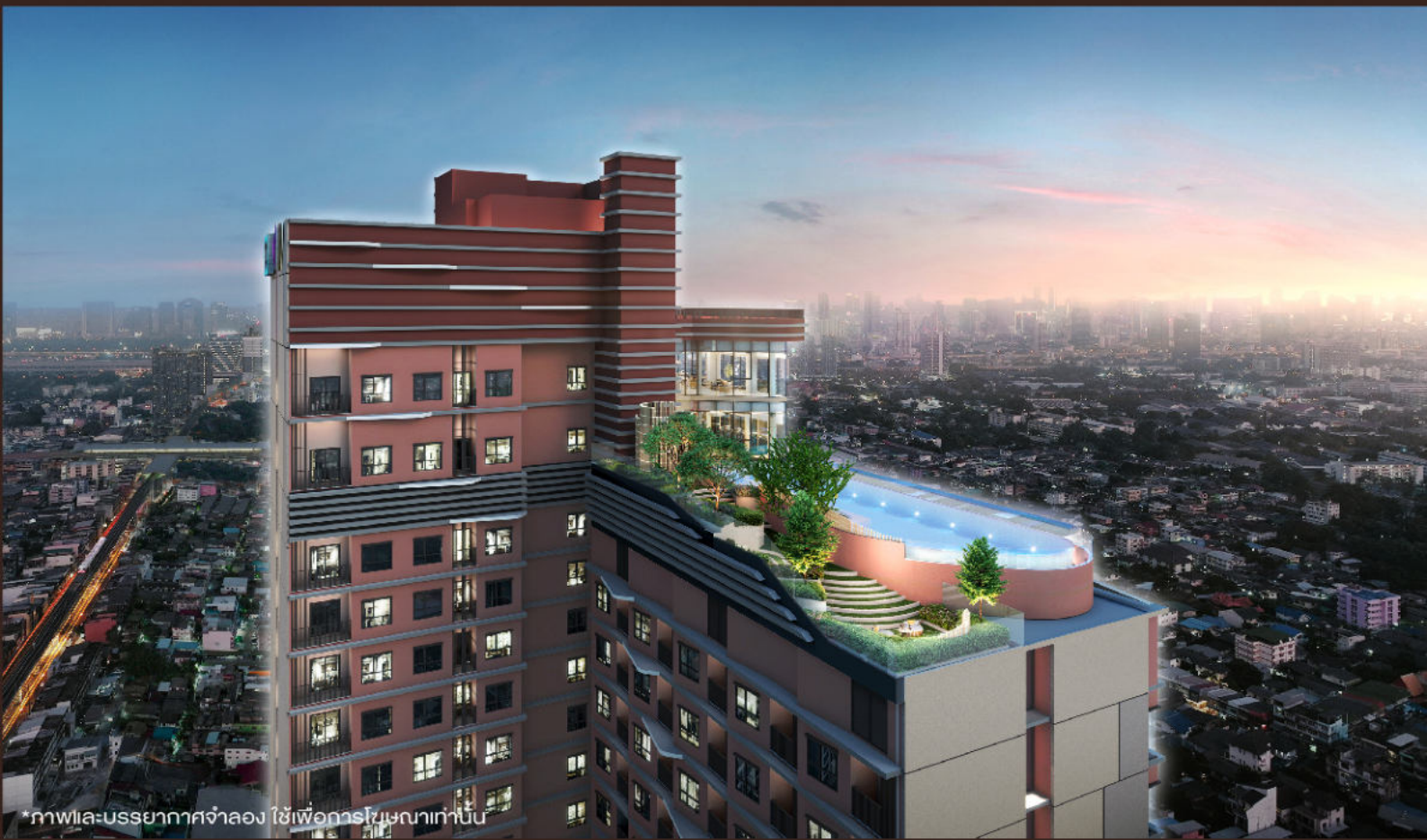
*ภาพและบรรยากาศจำลอง ใช้เพื่อการโฆษณาเท่านั้น