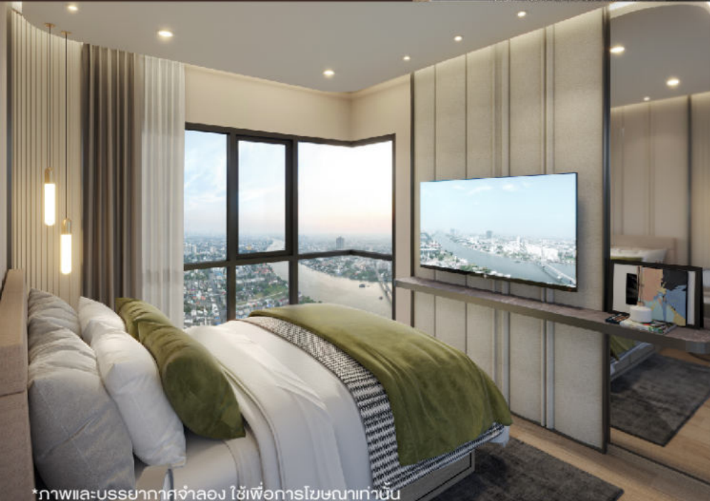
*ภาพและบรรยากาศจำลอง ใช้เพื่อการโฆษณาเท่านั้น