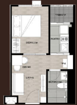
1-BR | 28 Sq.m.