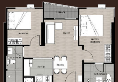
2-BR | 57 Sq.m.