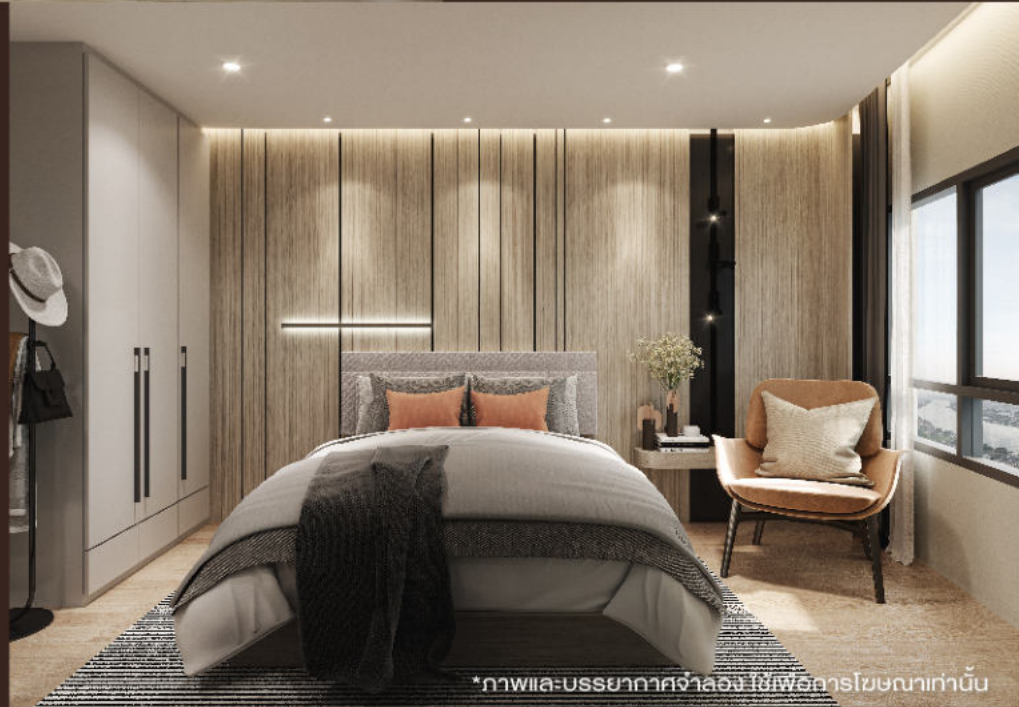
*ภาพและบรรยากาศจำลอง ใช้เพื่อการโฆษณาเท่านั้น