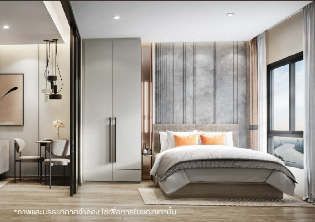
*ภาพและบรรยากาศจำลอง ใช้เพื่อการโฆษณาเท่านั้น