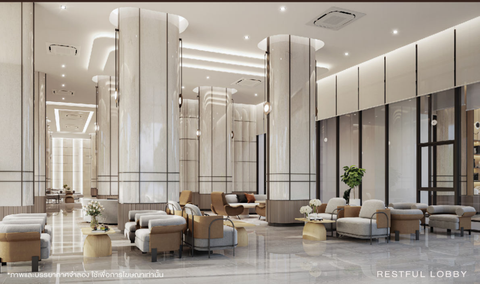
*ภาพและบรรยากาศจำลอง ใช้เพื่อการโฆษณาเท่านั้น